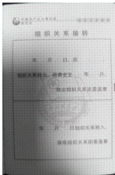
图二：团员证中“组织关系转接”页